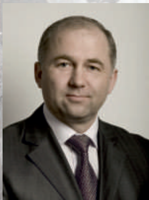
Е.И. Морозов, заместитель Председателя Законодательного Собрания Нижегородской области